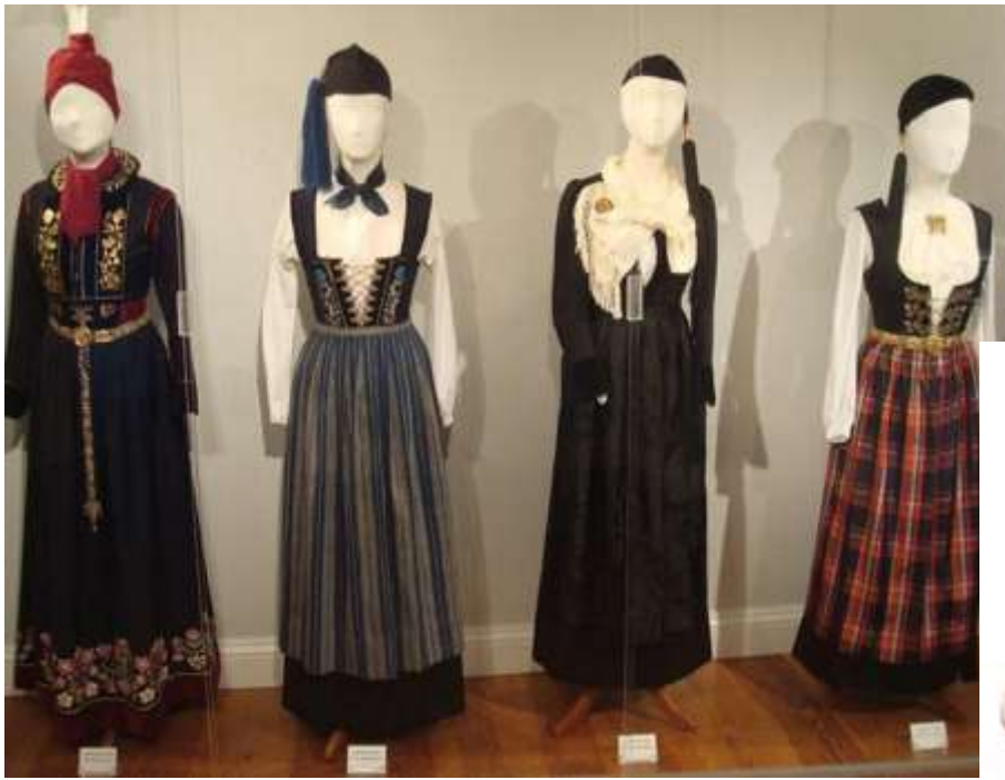
Biedermeier 1825 - 1838