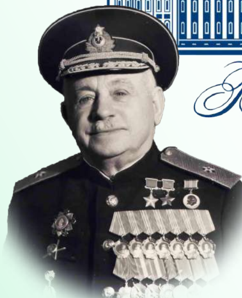
Папанин Иван Дмитриевич (1894–1986)

ИНСТИТУТ БИОЛОГИИ ВНУТРЕННИХ ВОД им. И.Д. ПАПАНИНА РАН