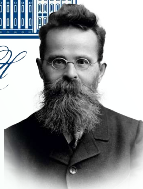
Морозов Николай Александрович (1854–1946)