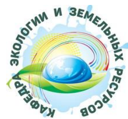
Кафедра экологии и земельных ресурсов