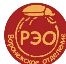
Воронежское отделение Русского энтомологического общества