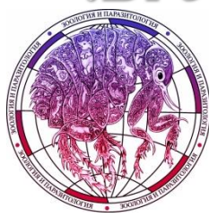
Кафедра зоологии и паразитологии